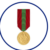
Médaille de la Famille