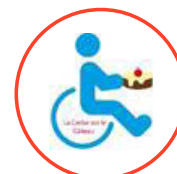
La cerise sur le gâteau