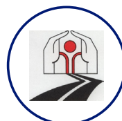
AFVAC Victimes de la circulation