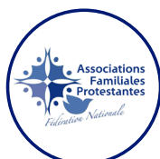
Association Familiale Protestante