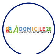
À Domicile 28