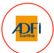
Défense des familles et des individus victimes de sectes