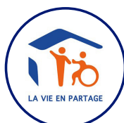
La Vie en Partage