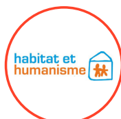
Habitat et Humanisme