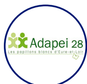
ADAPEI les Papillons Blancs